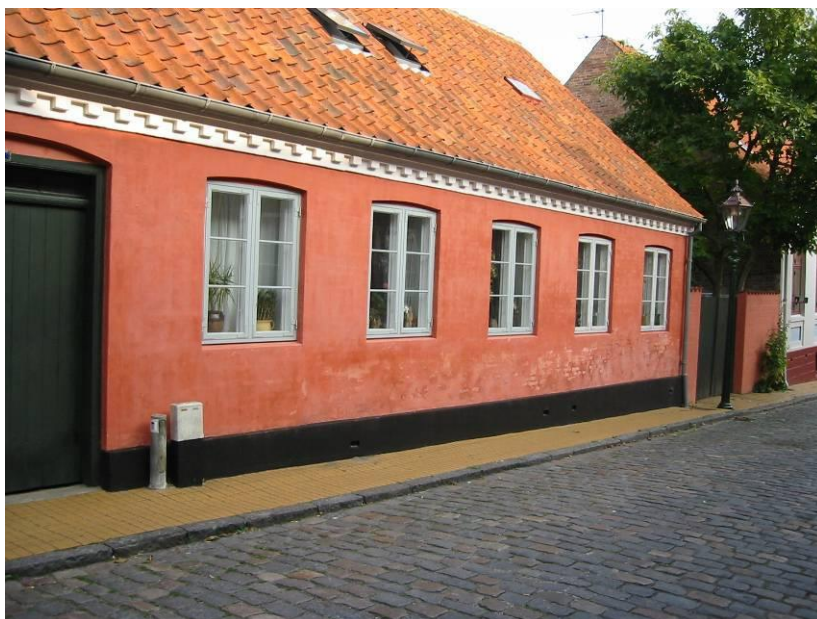
Rødkalket gadelængehus i Rønne.

Men een ting er at benytte de rigtige farve-nuancer, i smukt samspil med omgivelser og traditioner. Næste fejl mulighed er at farvesætte facaden forkert, d.v.s. male/kalke/overpudsede forskellige led og elementer forkert i forhold til hinanden. Hele facaden skal jo sjældent bare have een farve. Sokkel, indfatninger, gesims, bånd etc. bør ofte stå fremhævet i andre farver end vægfarven - soklen ofte mørkere, som regel sort eller mørkegrå, end grundfarven for at give "tyngde", gesimser, bånd og indfatninger ofte i en lysere farve ofte hvid, lysegrå eller lys pastel for at virke lette og "adskildende".