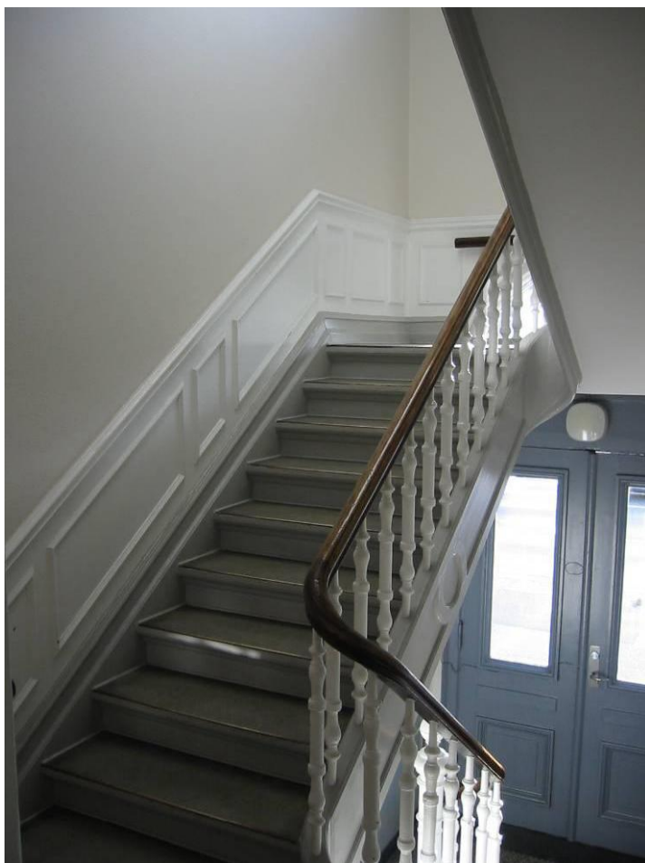
En typisk dansk trappeopgang med en 'indstemt trappe med drejede balustre, profilerede ydervanger og et 'falsk' brystningspanel langs indervæggen. Det 'falske' brystningspanel består af profilerede trælister, opsat direkte på væggen, som topliste, fyldinger og fodpanel, hvorefter 'panelet' er malet, som om det hele var af træ.

De blanke lakfarver kom frem i slutningen af 1800-taller og ligeså de naturlige, blanke, gennemsigtige lakker, fremstillet af linolie, harpiks, kopaler eller eksotiske træsafter. Disse giver en særlig smuk farvedybde og 'lød' i forhold til vore dages ensartede lak-produkter.