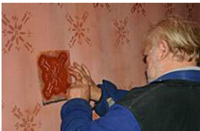
Limfarver og temperafarver kan også benyttes til skabelonmaling.

Temperafarver kan anvendes både på puds, på papir og på jutevæv (væglærreder). Som ved limfarver er man i de fleste tilfælde nødt til at blande og male selv, da de fleste malerfirmaer hellere vil rulle en gang plastmaling på.