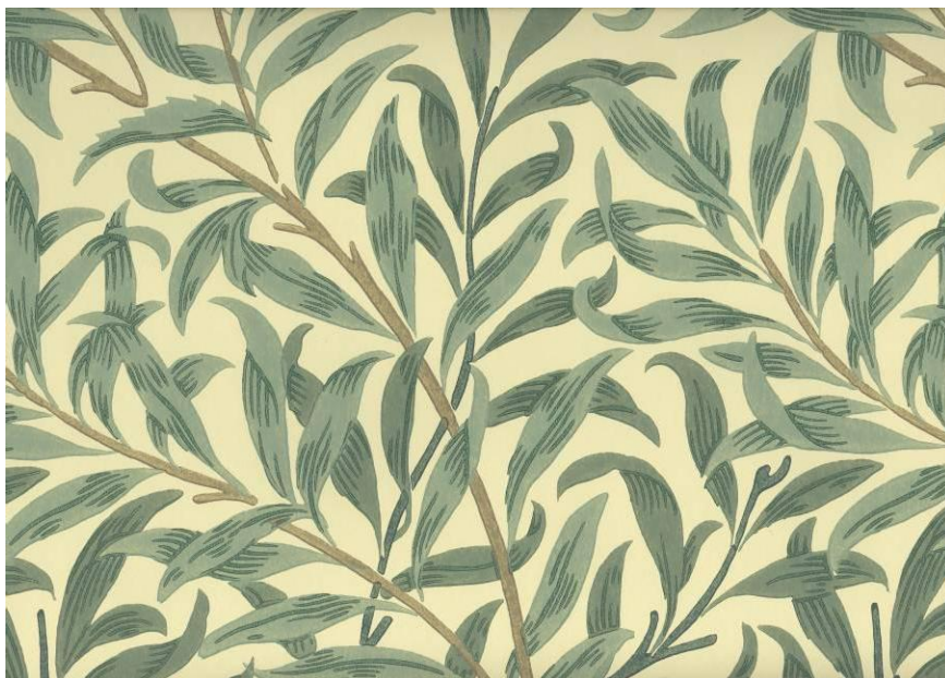
Tapet fra 1860-erne, 'Willow' (pil), tegnet og fremstillet af det britiske 'Art and Crafts'-ikon, William Morris. De fleste af William Morris' tapeter fås stadigvæk i England.

Ved begge metoder fremmer det processen hvis man prikker en masse huller i det gamle tapet – uden at ødelægge eller prikke huller i pudsen, som tapetet sidder på.