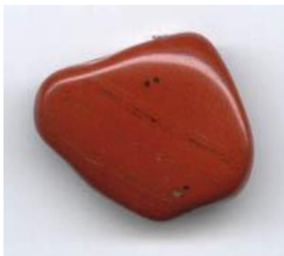
Hæmatit, også kaldt 'blodsten' kan også benyttes som smykkesten.

Pigmentet er kendt fra oldtiden, hvor det blev kaldt "blodsten" efter sin kraftige røde/rødbrune farve. Det er det samme navn, der går igen i hæmatit (græsk: haima = blod og lithos = sten). Et andet navn er jernglans , rødjernsten , jern-over-ilte .